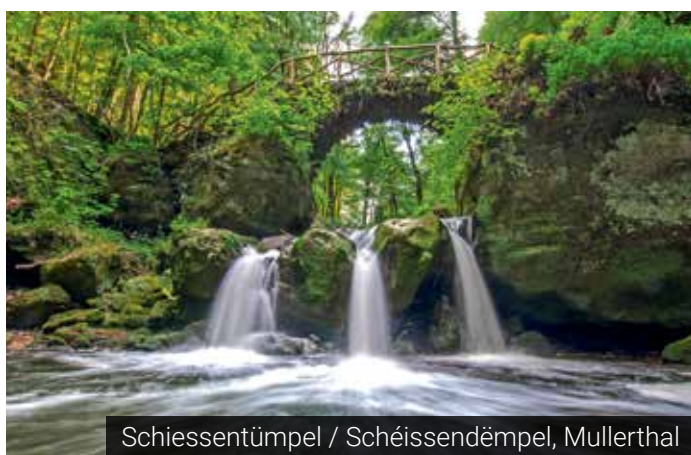
Schiessentümpel / Schéissendëmpel, Mullerthal

Des randonnées sur place sur le Mullerthal Trail avec transfert de retour en bus sont possibles | Ook zijn er wandeltochten op de Mullerthal Trail met retourtransfer per bus mogelijk.